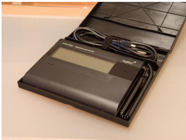
Im Einsatz: StepOver naturaSign Pad Standard mit Schutzbox

Die Reform des Versicherungsvertragsgesetzes im Jahr 2008 hat trotz besseren Verbraucherschutzes auch ihre Schattenseiten. Noch mehr Papier sorgt für noch mehr Verwaltungsaufwand bei den Versicherungsunternehmen. Um dem zu entfliehen, hat die Debeka-Gruppe im vergangenen Jahr die elektronische Signatur im Antragswesen eingeführt und damit auch die letzte Lücke im vollständig elektronischen Antragsprozess geschlossen.